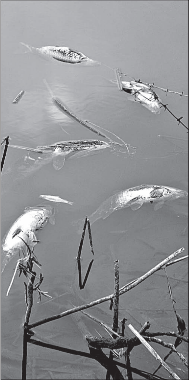
У оттаявших берегов качалась мертвая рыба, еще сотни пятен виднелись в середине озера.

Мы связались с коммунальной службой и попытались узнать, на каком основании вредные отходы попадают в реку, однако устно комментировать сложившуюся ситуацию в Щучинском ЖКХ не стали.